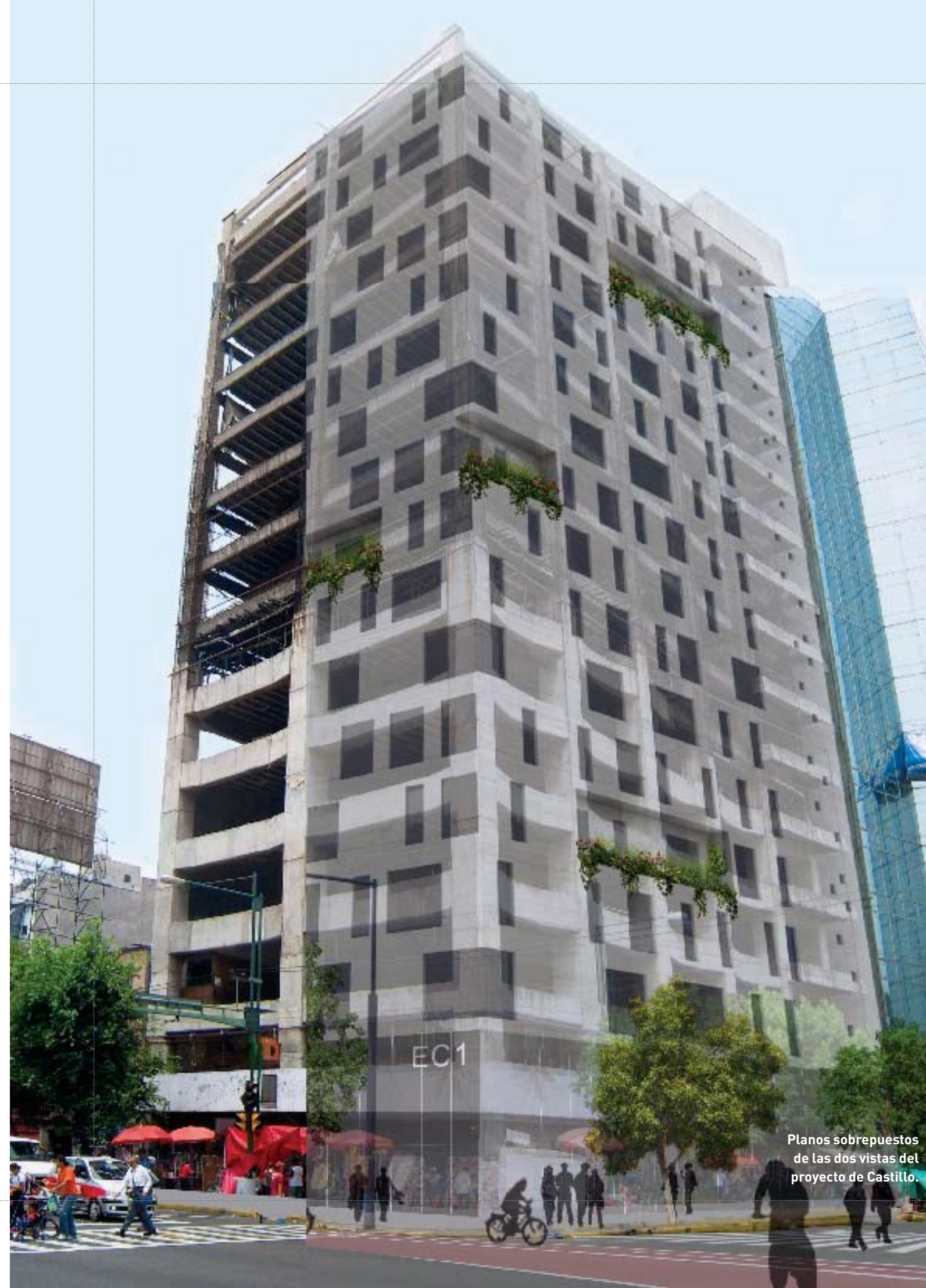
Planos sobrepuestos de las dos vistas del proyecto de Castillo.