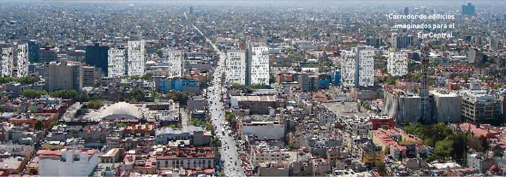
Corredor de edificios imaginados para el Eje Central.